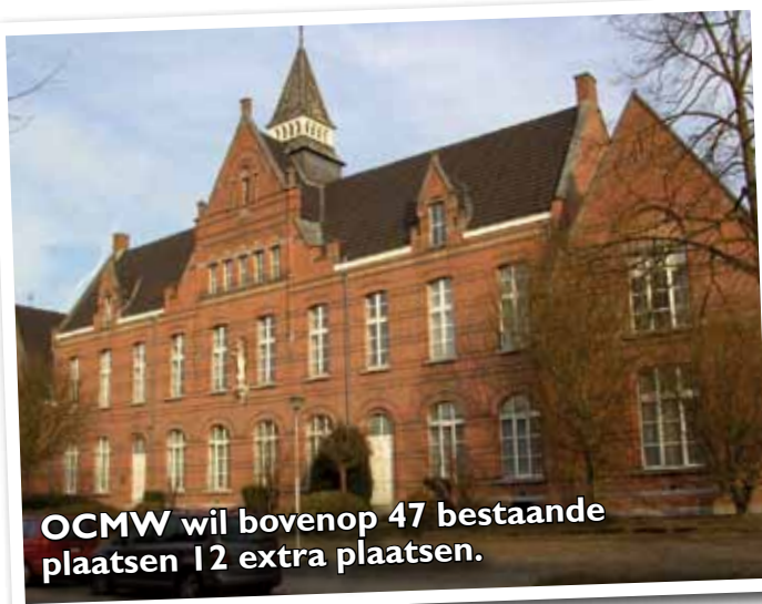
OCMW wil bovenop 47 bestaande plaatsen 12 extra plaatsen.

Wat ons betreft moet FEDASIL asielzoekers tijdens de volledige duur van de asielprocedure opvangen in gesloten centra zodat zij in geval